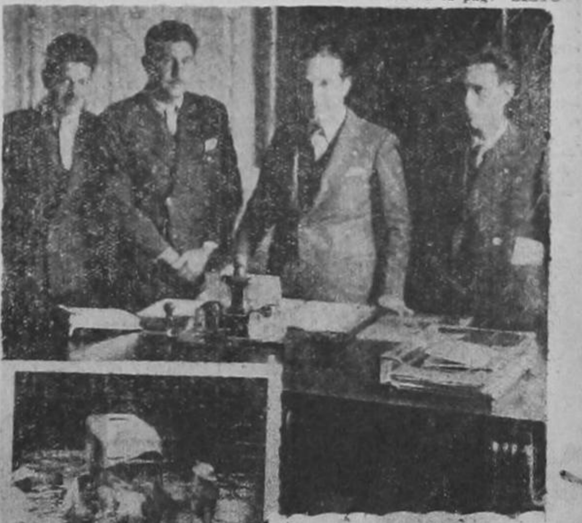
Los raidistas chilenos, fotografiados en Bogotá en compañía del Alcalde. Abajo: el Ford V-8, cuando llegaba a río Colorado, cerca de pueblo Nuevo de Coto.

TOKIO, 5. UP. — El correspondiente de la agencia noticiosa Domei en Hsinking informó que el alto mando del ejército de Kwantung anunció la destrucción de cincuenta y tres aviones mongol-soviéticos durante el día martes de esta semana. Sin confirmación se informa que otros 15 aviones fueron derribados. En los combates terrestres en ese mismo día los japoneses infligieron fuertes bajas en las tropas de la Mongolia exterior.